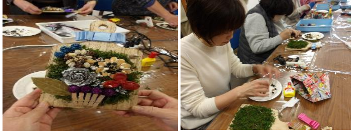
「みどりのクラフト教室」 開催の様子

公園を通じて植物に親しんでいただくため、金岡公園で「みどりのクラフト教室」を利用促進事業として年4回予定しておりましたが、令和7年度は講師との調整がつかず、2回(6/10、3/24)開催しました。