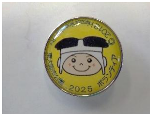
ボランティア表彰の様子と、令和7年度のピンバッジ(記念品)