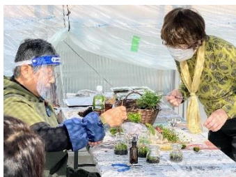
「みどりの教室」開催の様子

公園を通じて植物に親しんでいただくため、緩衝緑地において「みどりの教室」を利用促進事業として年4回開催します。講師は、弊社が連携・協力いただいている専門家もしくは弊社スタッフにより行います。