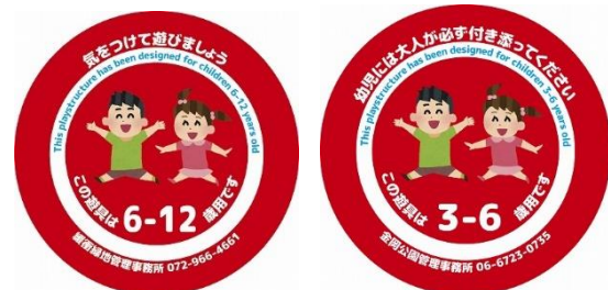
遊具の利用制限ステッカー(例)