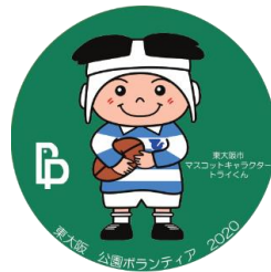
ボランティア表彰の様子と副賞のボランティアバッジ