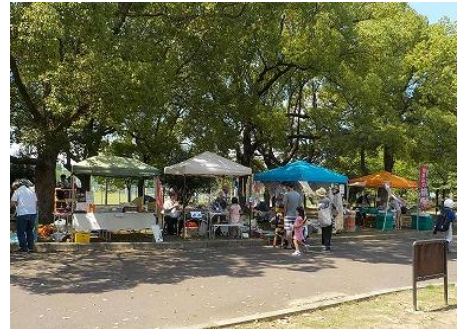
ハッピーカラーマルシェの様子

東大阪市民等で結成された「ハッピーカラーマルシェ実行委員会」との連携により、地産地消、手作り品の販売、ワークショップ等を提供する『ハッピーカラーマルシェ』を開催し、東大阪市民の活動の場を広げるとともに、地域振興、金岡商店街の活性化、公園の賑わいづくりに貢献します。