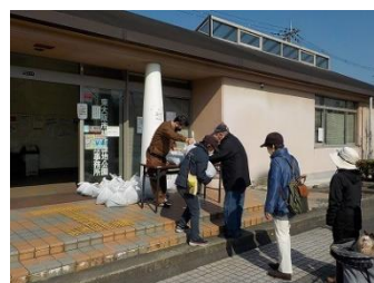
パークチップ無料配布