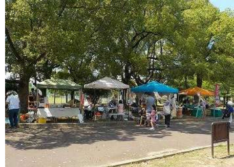
ハッピーカラーマルシェの様子

東大阪市民等で結成された「ハッピーカラーマルシェ実行委員会」との連携により、地産地消、手作り品の販売、ワークショップ等を提供する『ハッピーカラーマルシェ』を開催し、東大阪市民の活動の場を広げるとともに、地域振興および活性化、公園の賑わいづくりに貢献します。