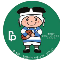
ボランティア表彰の様子と副賞のボランティアバッジ