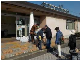
パークチップ無料配布

当社が管理している他公園と連携し、園内の維持管理による剪定枝をパークチップにして、利用者に無料配布し、地域の緑化活動や農業に役立てていただき、サービス向上を図ります。