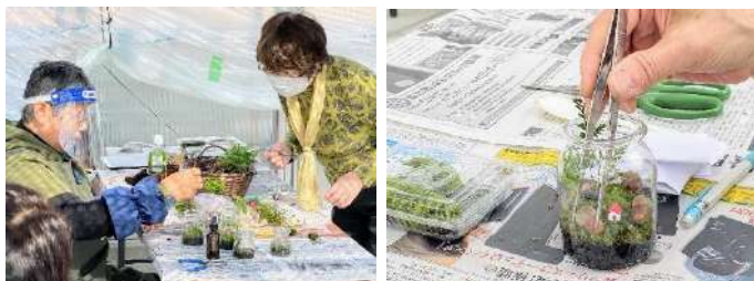
「みどりのクラフト教室」開催の様子(イメージ)

公園を通じて植物に親しんでいただくため、金岡公園において「みどりのクラフト教室」を自主事業として年4回開催します。講師は、弊社が連携・協力いただいている専門家もしくは弊社スタッフにより行います。