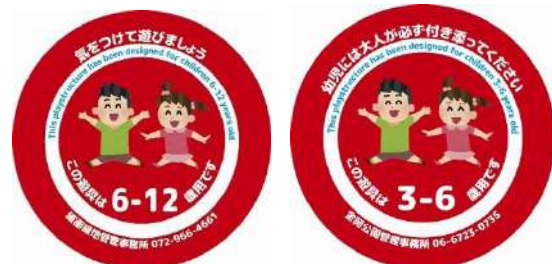
遊具の利用制限ステッカー(例)